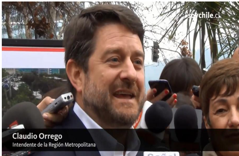
Claudio Orrego Intendente de la Región Metropolitana