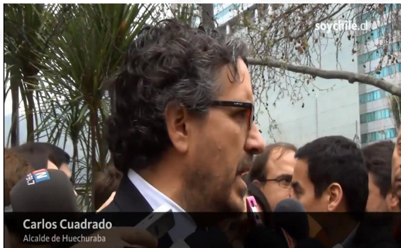
Carlos Cuadrado Alcalde de Huechuraba