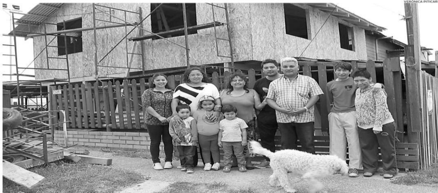
LA FAMILIA POSA AFUERA DE LA CASA QUE TIENE LA CONSTRUCCIÓN DEL SEGUNDO PISO DETENIDA, YA QUE BUSCAN LA POSIBILIDAD DE QUEDARSE EN EL LUGAR.

Como las relaciones con los vecinos se tornaron hostiles,