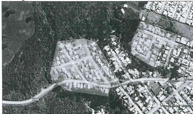
Figura 1 Área de ubicación sector de Villa Los Esteros sin saneamiento

Los inicios del proyecto para sanear el sector datan desde hace varios años, debido a cambios de trazado por problemas de autorización de servidumbres de paso y terrenos para la ubicación de la planta elevadora de aguas servidas.