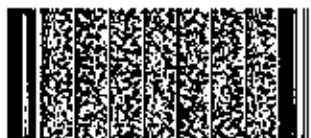
Timbre electrónico SRCal

Verifique documento en www.registrocivil.gob.cl o a nuestro Call Center 600 370 2000, para teléfonos fijos y celulares. La próxima vez, obtén este certificado en www.registrocivil.gob.cl .