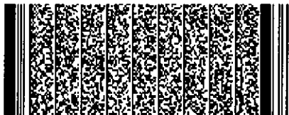
Timbre electrónico SRCel

Verifique documento en www.registrocivil.gob.cl o a nuestro Call Center 600 370 2000, para teléfonos fijos y celulares. La próxima vez, obtén este certificado en www.registrocivil.gob.cl .