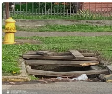
A la altura de 1889 santa maría 16:59

7.- CONCEJALA CANALES: “Señor Alcalde, para mi punto tengo unas fotografías: