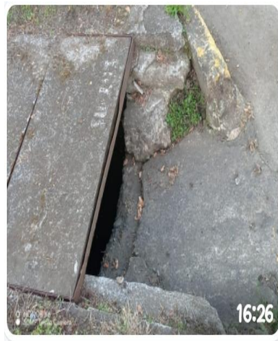
Esa esta a la altura de. 1907 santa maría 16

Esto es en calle Santa María, para que puedan ver esa situación, son 3, por favor, porque no se ha mejorado en nada.