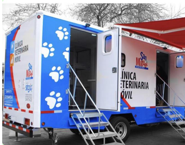
d) clínica móvil